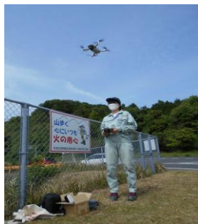
ドローン実習風景