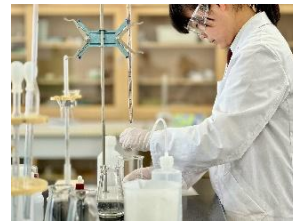
ものづくりコンテスト(化学分析)

【 電子情報科 】○情報制御コース ○情報通信コース 「変化の時代を乗り越える取組」