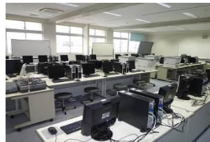
充実の CAD 教室