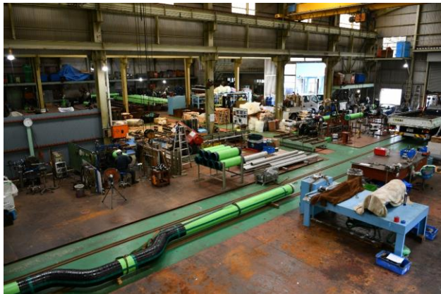
第二工場内 作業場