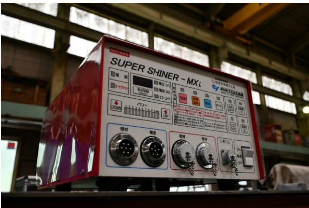
ステンレス焼取機