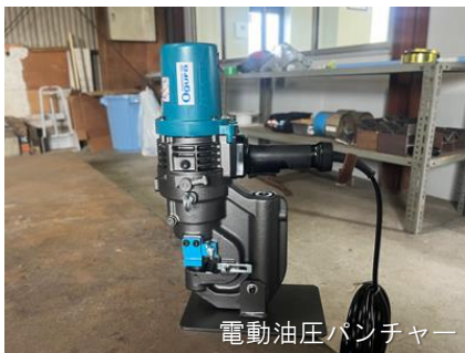
電動油圧パンチャー