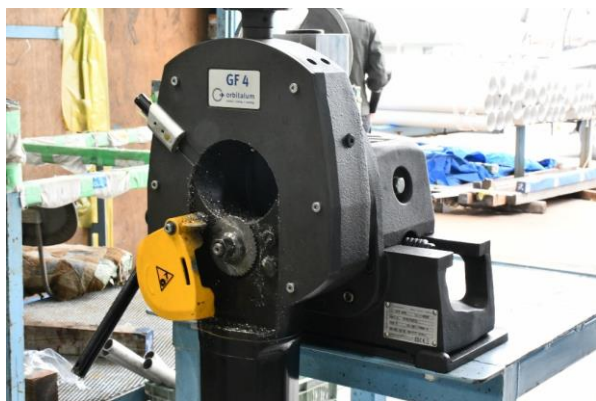
高速パイプ切断装置