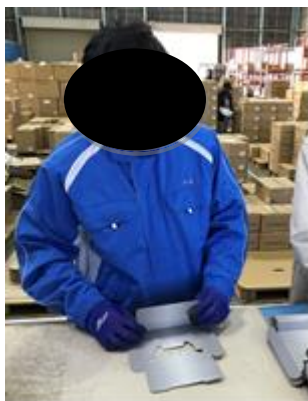
製造業での現場実習の様子