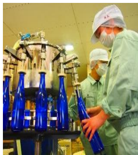
試験醸造酒 ビン詰め作業

ジャム、パン・菓子、発酵食 品等の各種加工食品製造に加 え、成分分析や酵母等の微生 物利用等、食について幅広い 学習活動を行っています。ま た、地域と連携した商品開発 にも取り組みます。