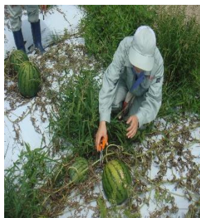
スイカの栽培・収穫作業

作物・野菜・果樹・草花の栽培 や家畜の飼育を通して、農産物の 特性や栽培管理技術、流通・ 販売、活用方法などを学びます。 授業や実習で、実践し、経験を 積むことで、安全・安心な農産 物づくりに必要な知識・技術や 態度を身に付けます。