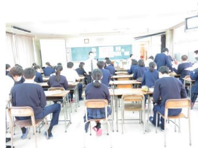
ボランティア講座